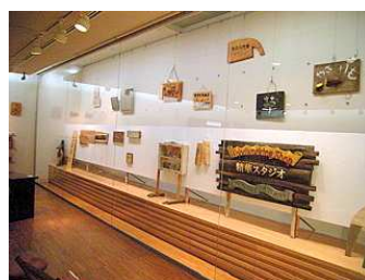
ウッドサイン展の様子