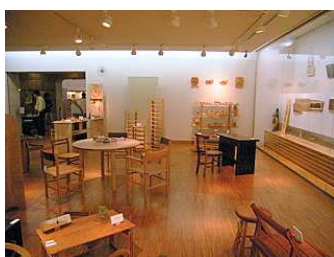
昨年の会場の様子

最終日の9月25日（日）午前中には作り手本人によるギャラリートークも開催します。